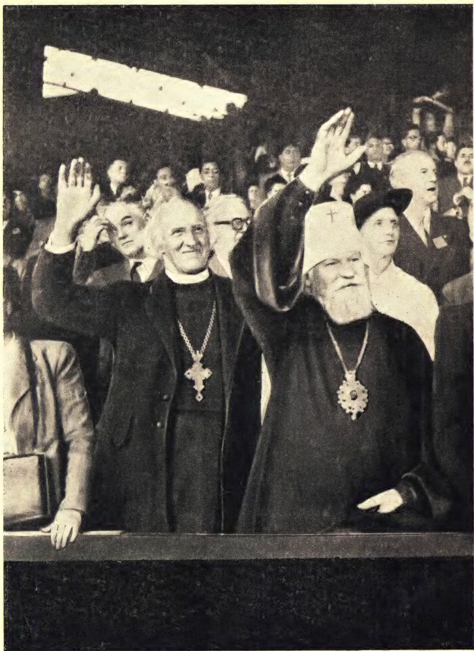
Митрополит Николай приветствует манифестацию на стадионе Буффало в Париже в дни Конгресса. Справа от него — д-р Хьюлетт Джонсон, настоятель Кенгерберийского собора.